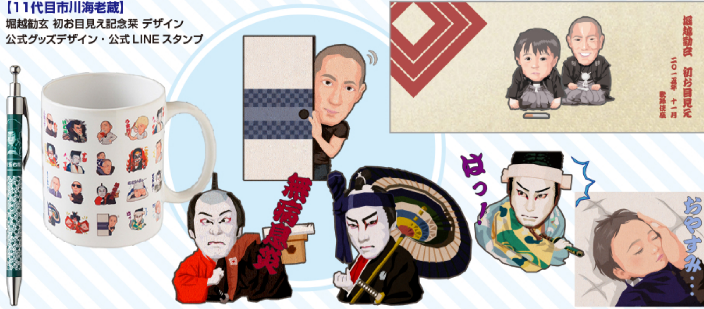
【11代目市川海老蔵】 堀越勲玄 初お目見え記念案 デザイン 公式グッズデザイン・公式LINEスタンプ

オリジナルコンテンツの開発・制作とその先にある様々な商品展開までを総合的に考え、グッズをデザインする事はスタジオ・オカノーションの要です。 手に取ってくれた人が笑顔になるようなデザインにしています。