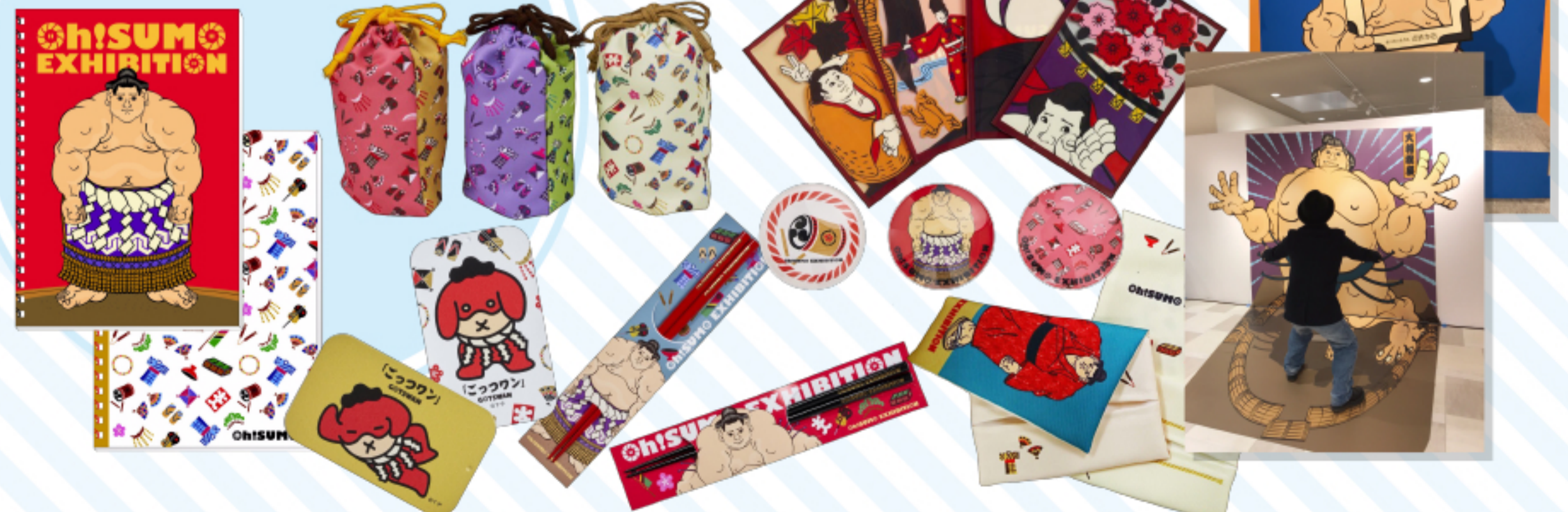
大相撲展 [oh! SUMO EXHIBITION] ロゴ・全グッズ・メインビジュアル・だまし絵&顔はめパネル 大相撲展限定公式キャラクターデザイン・アニメーション作成